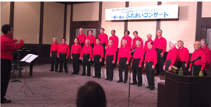
6月26日ふれあいコンサート（上：合同演奏、下：昂）

6月26日(水)、琵琶湖周航の歌の「今津港」のある高島市で行われた、コーラス水輪との合同演奏会「一期一会のふれあいコンサート」に出演しました。