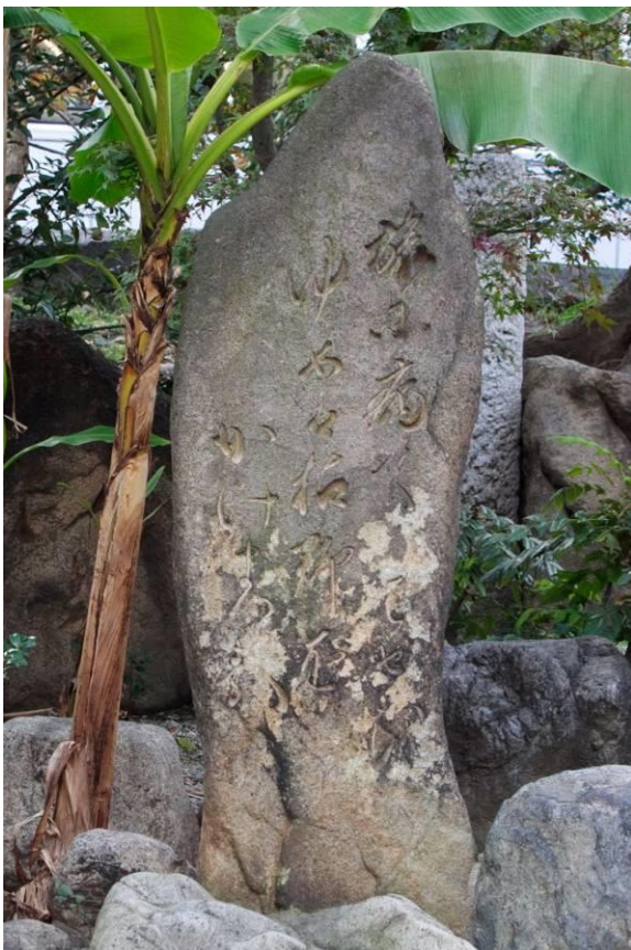
「南御堂」 本堂南側の庭園「獅子吼園」の歌碑