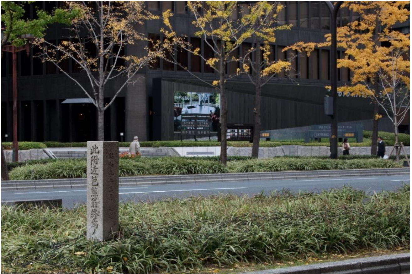
御堂筋「南御堂」前東側分離帯 (南御堂前花屋跡)