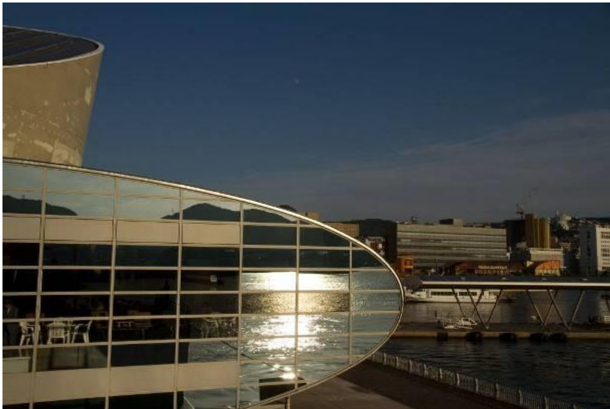
フェリー五島より大波止に入港