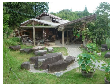
杉・五兵衛のテラスハウス