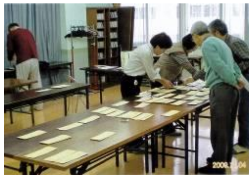
チケット抽選風景